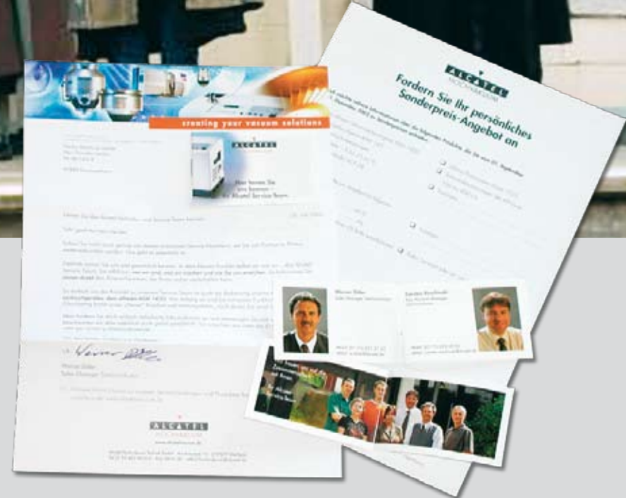
20g-Standard-Mailing mit aufgespendetem Mini-Prospekt zur Bekanntmachung des Serviceteams