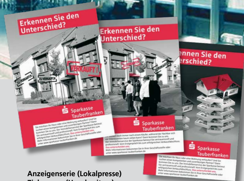
Anzeigenserie (Lokalpresse) Zielgruppe (Hausbesitzer)