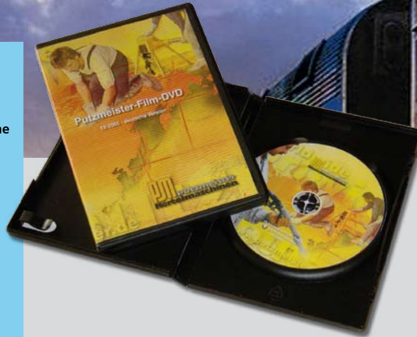
Schnitt von Anwendungsfilmen und Programmierung einer DVD für den Außendienst

Wir bieten Ihnen auch hier eine Komplettleistung . Von der Idee bis hin zur Fertigstellung Ihrer Filmproduktion. Von der Beratung über Konzept, Produktion, Vervielfältigung bis hin zur Covergestaltung.