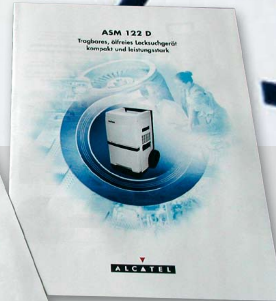
Produkt-Prospekte: Zielgruppe Physiker