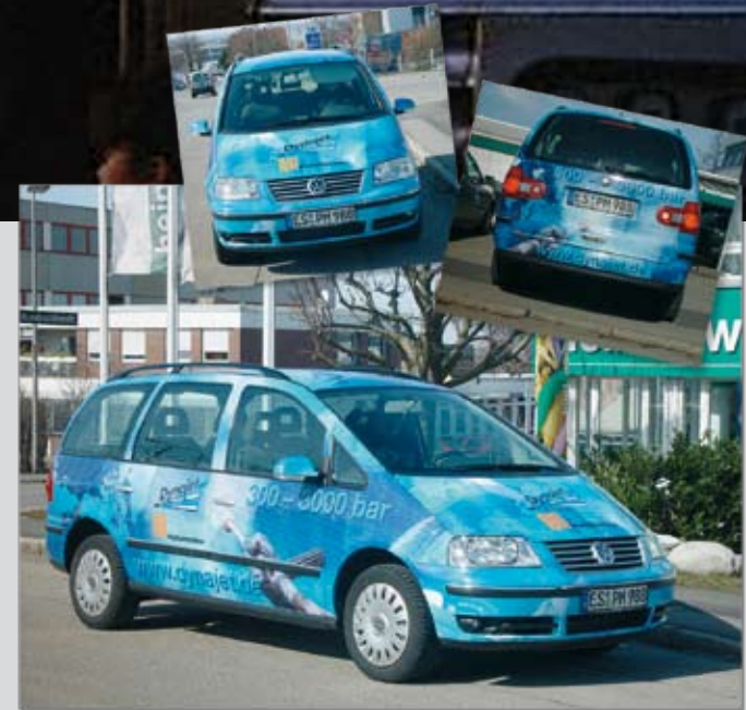
Komplette Effekt-Beschriftung von Außendienst-Fahrzeugen