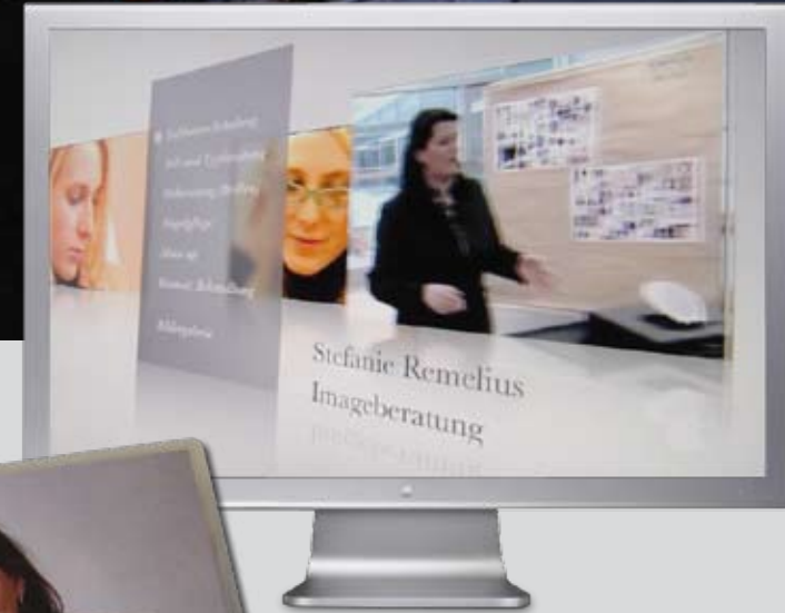
Darstellung des Leistungsspektrums über eine professionell gestaltete und programmierte DVD