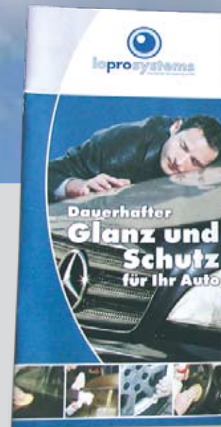
...und seines Leistungsspektrums Zielgruppe Privatpersonen + Handel