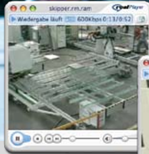
Diverse Industrie- filme (z. B. Holzver- arbeitung) für den Einsatz im Internet

Auf Messen, für Schulungen, beim Beratungsgespräch, im Internet oder auf Datenträgern wie z. B. DVDs... Die Einsatzbereiche sind vielfältig.