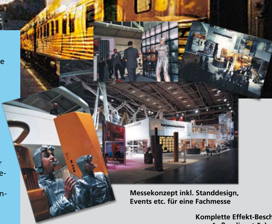
Messekonzept inkl. Standdesign, Events etc. für eine Fachmesse

Wir entwerfen natürlich auch Logos und die dazu passenden Geschäftsunterlagen. Wir erstellen Ihr Corporate Design und sorgen für seine Einhaltung. Wir helfen Ihnen bei Ihren Events oder entwickeln ein erfolgreiches Messekonzept. Es gibt eigentlich kaum etwas, das wir nicht für Sie tun können. Wir lernen ja schließlich auch ständig dazu.