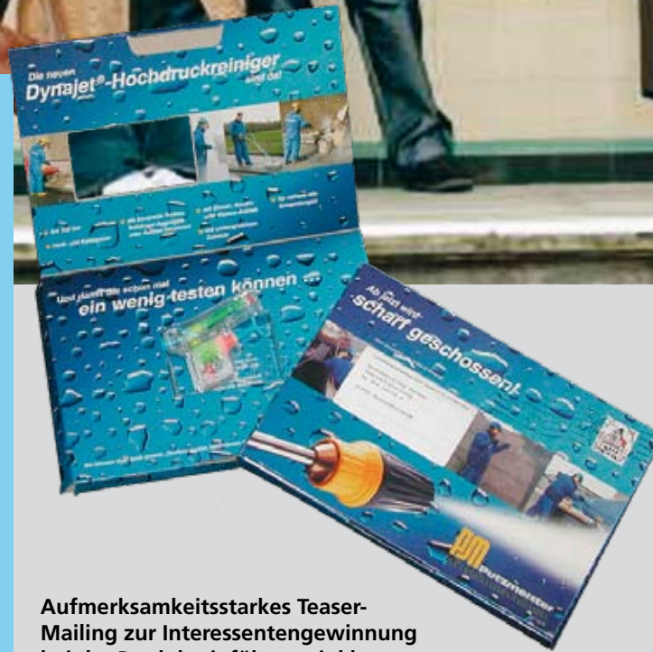
Aufmerksamkeitsstarkes Teaser-Mailing zur Interessentengewinnung bei der Produkteinführung inkl. Telefon-Aktion

Wir beraten Sie gerne über die Chancen und Risiken, die sich Ihnen durch Direktmarketing bieten.