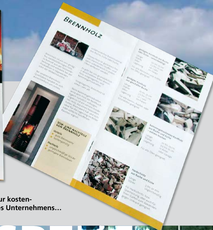
8-seitige LangDIN-Prospekte zur kostengünstigen Kurz-Darstellung des Unternehmens...