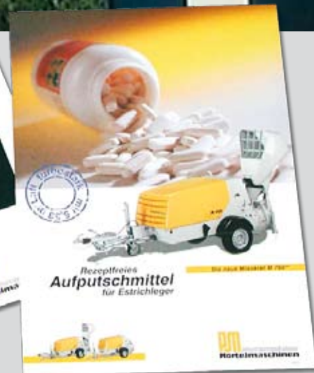
Produkteinführungs-Flyer und nachgeschaltete, umfangreiche Produkt-Prospekte