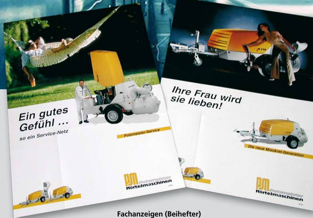
Fachanzeigen (Beihefter) Zielgruppe Estrichleger